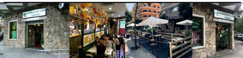
Don Ramón de la Cruz 88 - Tel 914016334