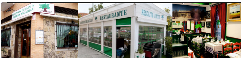
Camilo José Cela 11 - Tel 913556927